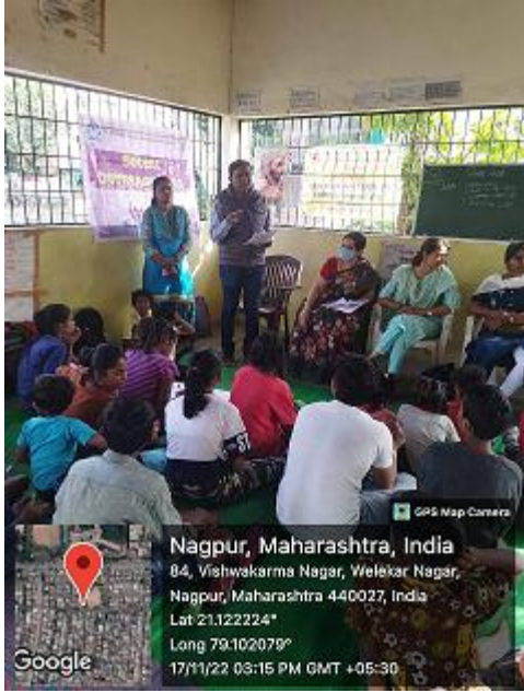
Nagpur, Maharashtra, India 84, Vishwakarma Nagar, Welekar Nagar, Nagpur, Maharashtra 440027, India Lat 21.122224° Long 79.102079° 17/11/22 03:15 PM GMT +05:30

अपनी ही कक्षा में एक कार्यक्रम आयोजित किया गया था। इस कार्यक्रम में हमने अपने देश के बारे में बहुत कुछ सीखा। हमने जाना कि हमारे देश में बहुत सारे लोग हैं जो बहुत ही गरीब हैं। हमने भी इन लोगों को मदद करने का फैसला किया। हमने एक कलेक्शन शुरू किया और हमने बहुत सारे पैसे इकट्ठा किए। हमने इन पैसे को उन लोगों को दे दिया जो बहुत ही गरीब हैं। हमने उन लोगों को बहुत ही खुशी दी। हमने उन लोगों को बताया कि हम उनका हाथ धोएंगे। हमने उन लोगों को बताया कि हम उनका हाथ धोएंगे। हमने उन लोगों को बताया कि हम उनका हाथ धोएंगे।